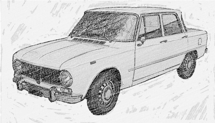
FOTO ¾ ANTERIORE CON TARGA VISIBILE